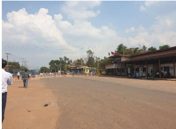
บริเวณจุดผ่านแดน