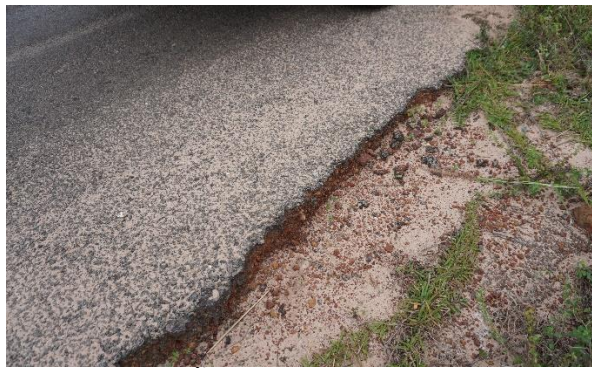
สภาพพื้นผิวถนนที่ชำรุดเสียหาย