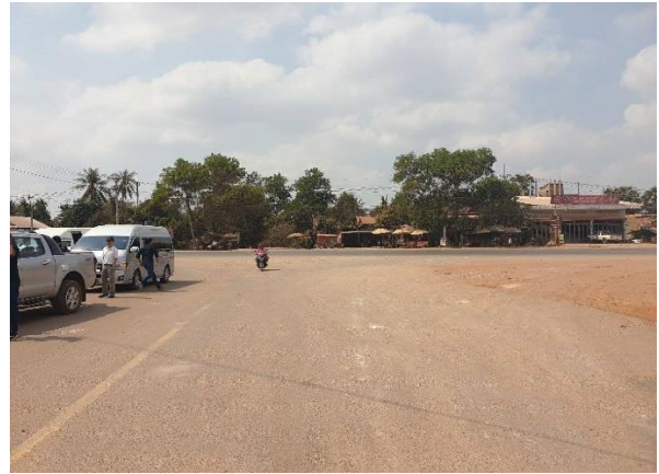
บริเวณทางแยกของถนนหมายเลข 67