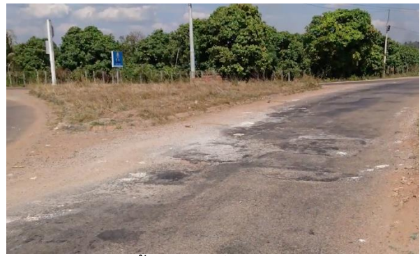
สภาพพื้นผิวถนนที่ชำรุดเสียหาย