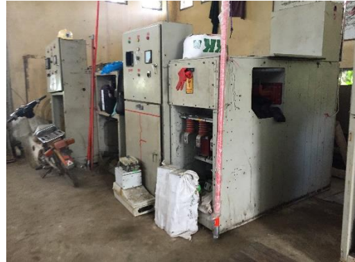
สถานีไฟฟ้าย่อย Shwe Pauk Kan