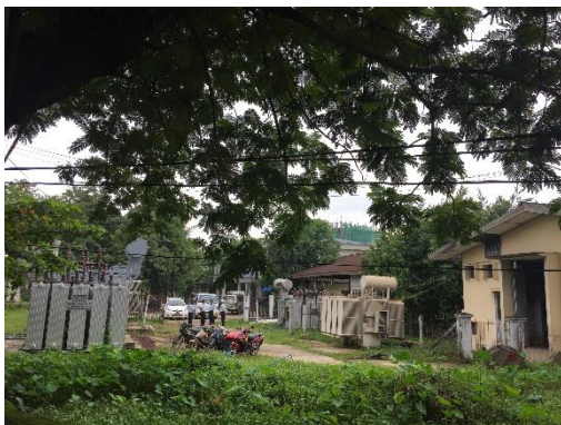
สถานีไฟฟ้าย่อย North Okkalapa