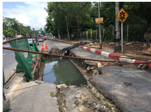
สายส่งไฟฟ้าในปัจจุบัน