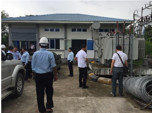
สถานีไฟฟ้าย่อย Wai Bar Gi