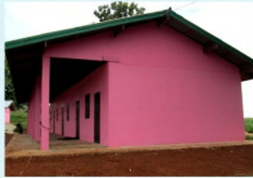
ดำเนินการแล้วเสร็จ