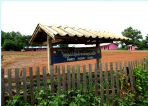
สภาพก่อนดำเนินการ