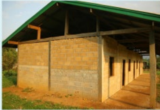
สภาพก่อนดำเนินการ