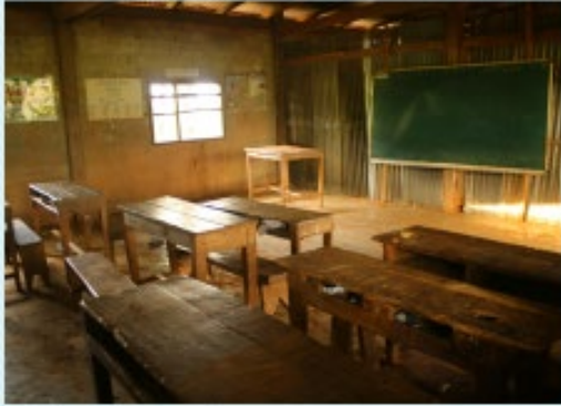
สภาพก่อนดำเนินการ