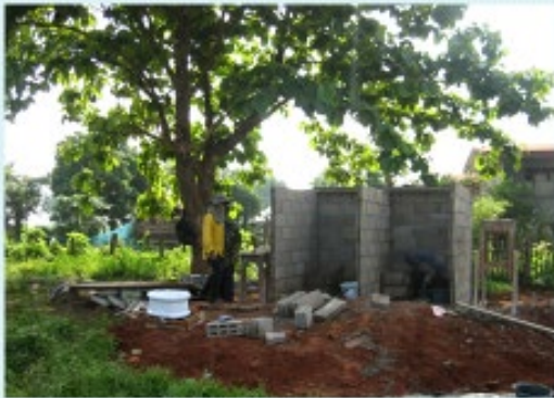
สภาพระหว่างดำเนินการ