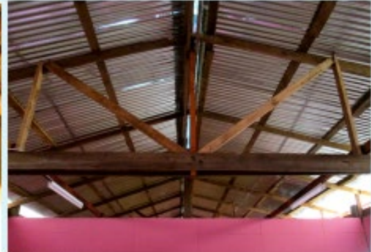
ดำเนินการแล้วเสร็จ