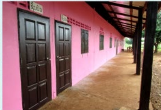
ดำเนินการแล้วเสร็จ