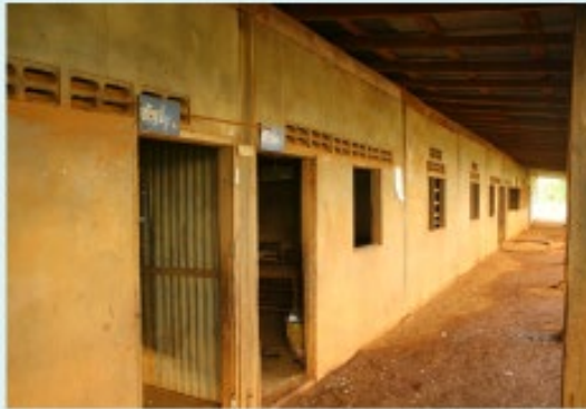
สภาพก่อนดำเนินการ