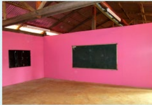
ดำเนินการแล้วเสร็จ