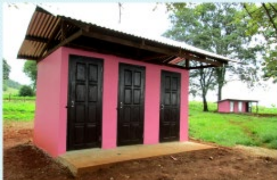
ดำเนินการแล้วเสร็จ