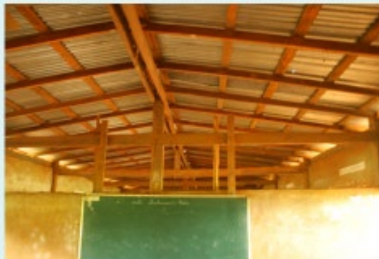
สภาพก่อนดำเนินการ