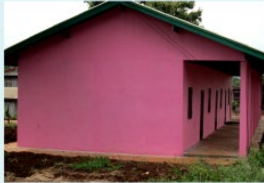
ดำเนินการแล้วเสร็จ