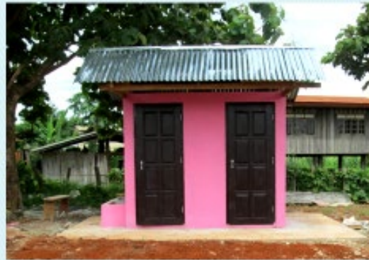
ดำเนินการแล้วเสร็จ