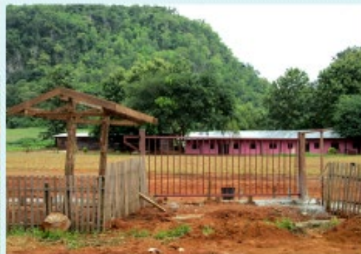
สภาพระหว่างดำเนินการ