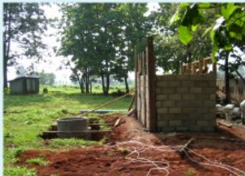
สภาพระหว่างดำเนินการ