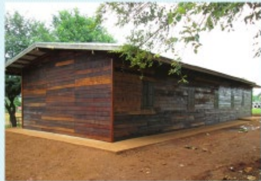
สภาพก่อนดำเนินการ