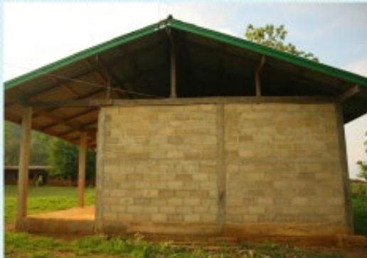
สภาพก่อนดำเนินการ