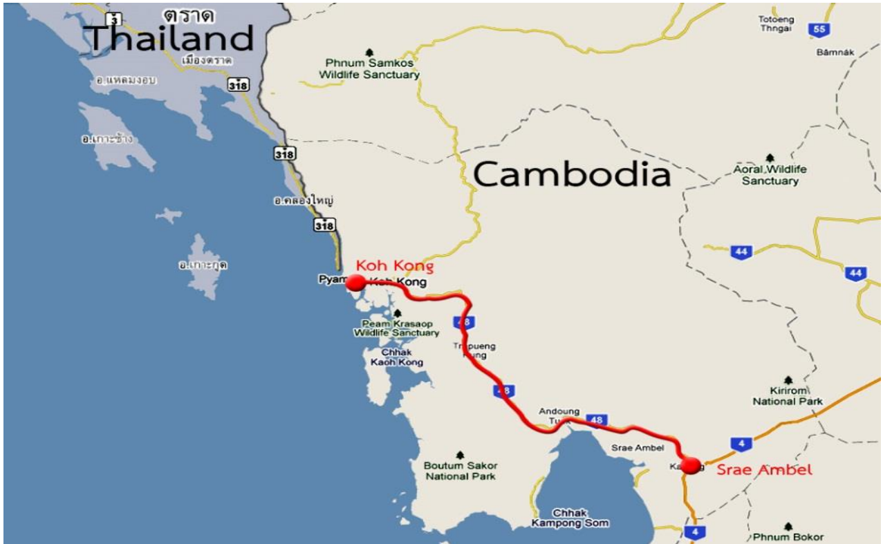
ภาพแผนที่เส้นทางการเดินทาง

โครงการพัฒนากนหนหมายเลข 48 ช่วงเกาะกง-สะเรอัมเบิล (R48) ราชอาณาจักรกัมพูชา