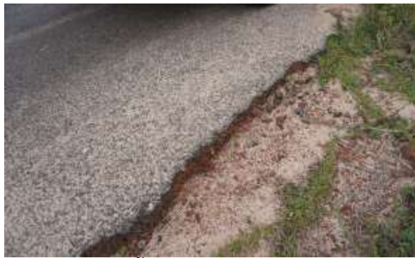
สภาพพื้นผิวถนนที่ชำรุดเสียหาย