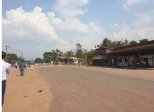
บริเวณจุดผ่านแดน