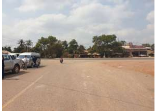
บริเวณทางแยกของถนนหมายเลข 67