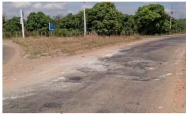
สภาพพื้นผิวถนนที่ชำรุดเสียหาย