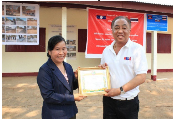
(รองเจ้าเมืองฯ มอบประกาศนียบัตรแสดงความขอบคุณ สพพ.)