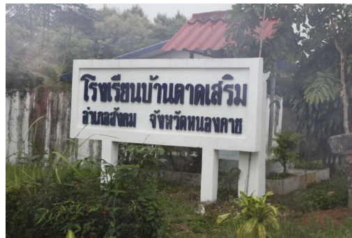
บริเวณอาคารเรียน