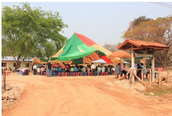
(บริเวณงานพิธีฯ)