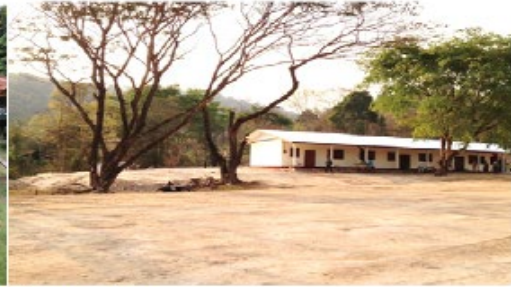
(บริเวณด้านหลังอาคารเรียน)