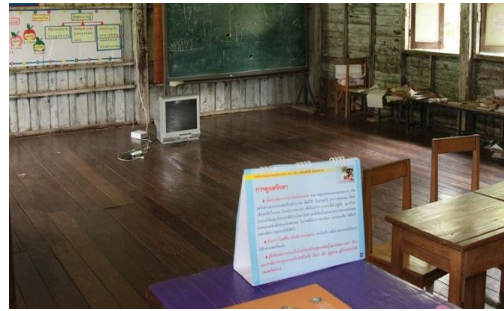
ห้องเรียน