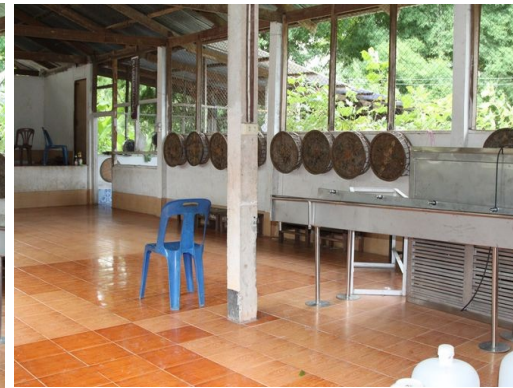
โรงอาหาร