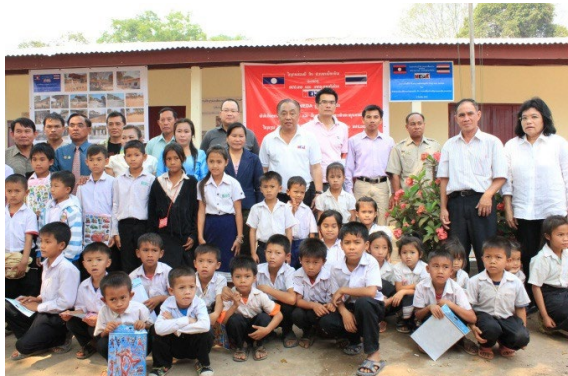
(คณะผู้บริหารถ่ายภาพพร้อม)