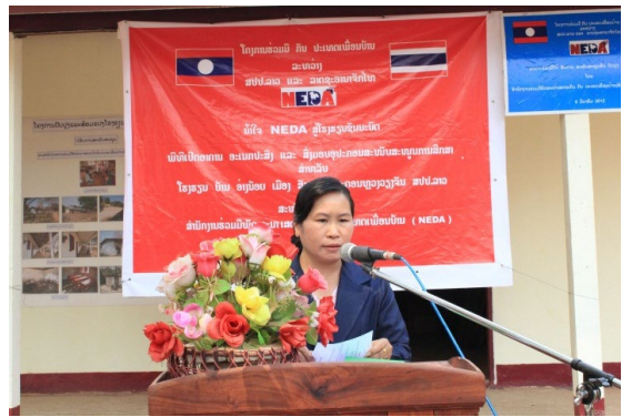
(รองเจ้าเมืองสังทอง ประธานในพิธีฯ ฝั่งลาว)