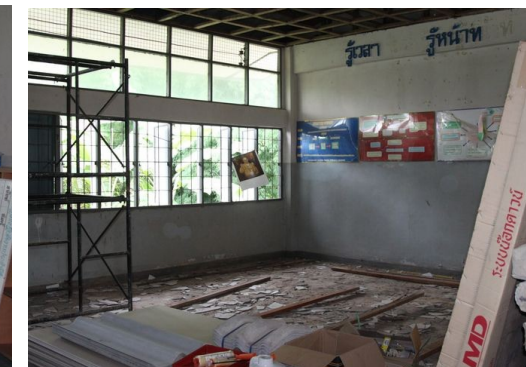
ห้องเรียนอนุบาล