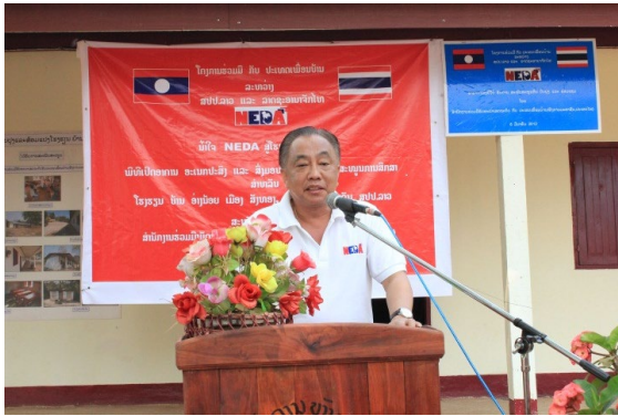
(ผอ.สพพ.ประธานในพิธีฯ ฝั่งไทย)