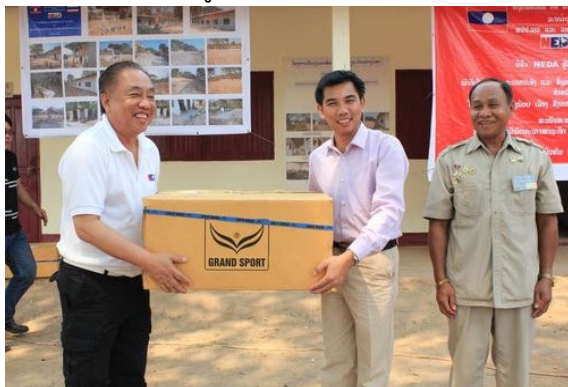
(ส่งมอบอุปกรณ์กีฬาให้ครูใหญ่ทั้ง 2 โรงเรียน)