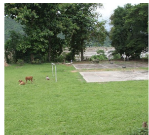
ลานกิจกรรม