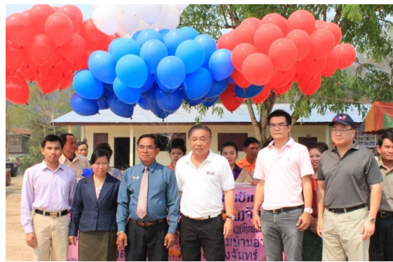
(พิธีตัดริบบิ้น)