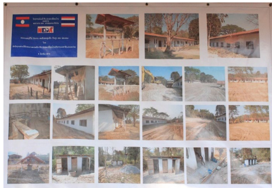
(บอร์ดประชาสัมพันธ์)