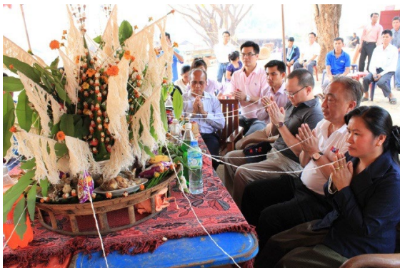
(พิธีบายศรีสู่ขวัญ)