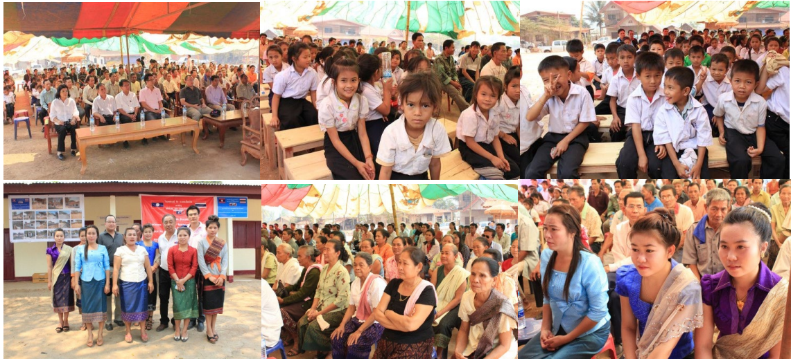
(บรรยายภาคผู้เข้าร่วมงาน)