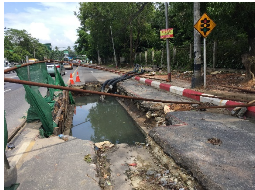
สายส่งไฟฟ้าในปัจจุบัน