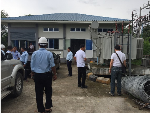
สถานีไฟฟ้าย่อย Wai Bar Gi