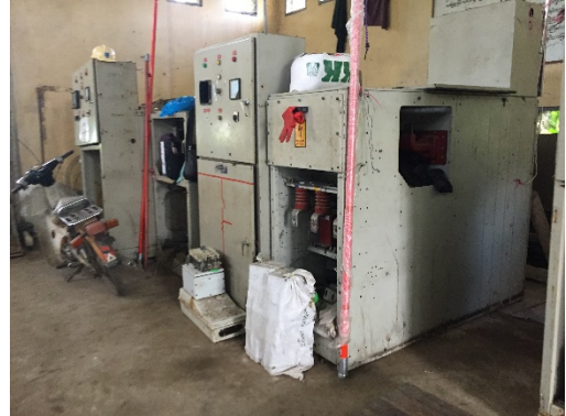
สถานีไฟฟ้าย่อย Shwe Pauk Kan