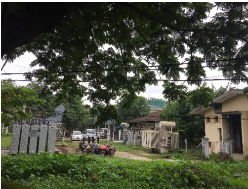
สถานีไฟฟ้าย่อย North Okkalapa