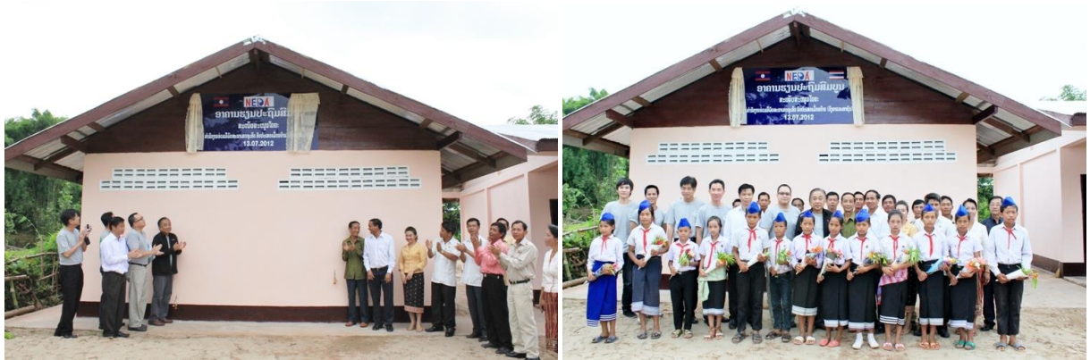
1.สปป.ลาวให้การต้อนรับคณะเดินทางฯ และรับชมการแสดงของนักเรียน