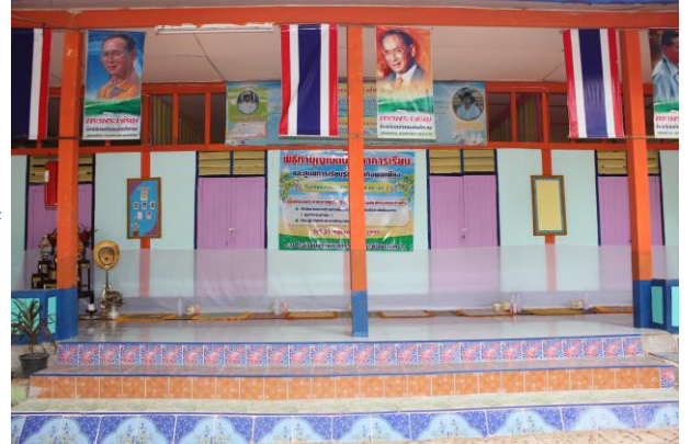
(หลังดำเนินการ)