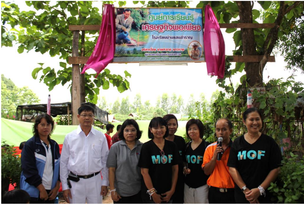
1. ผลผลิตจากการปลูกพืชผักสวนครัว เพื่ออาหารกลางวันของเด็ก