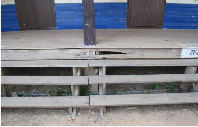
(ก่อนดำเนินการ)