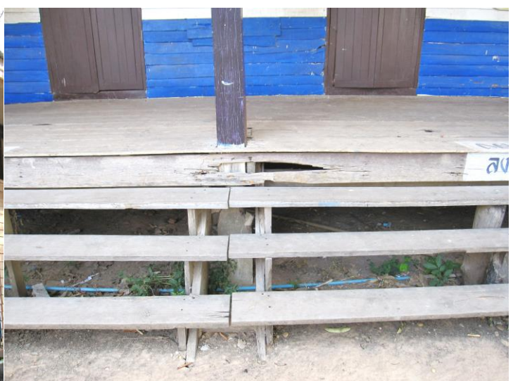
ภาพโรงเรียนก่อนรื้อถอน