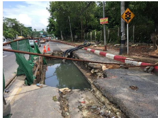
สายส่งไฟฟ้าในปัจจุบัน