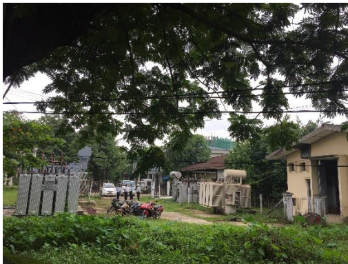
สถานีไฟฟ้าย่อย North Okkalapa