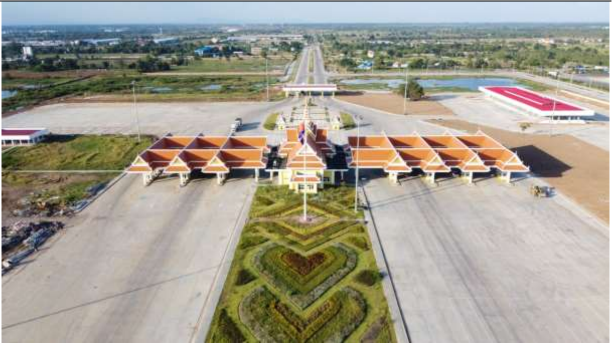
Arrival and Departure booth check