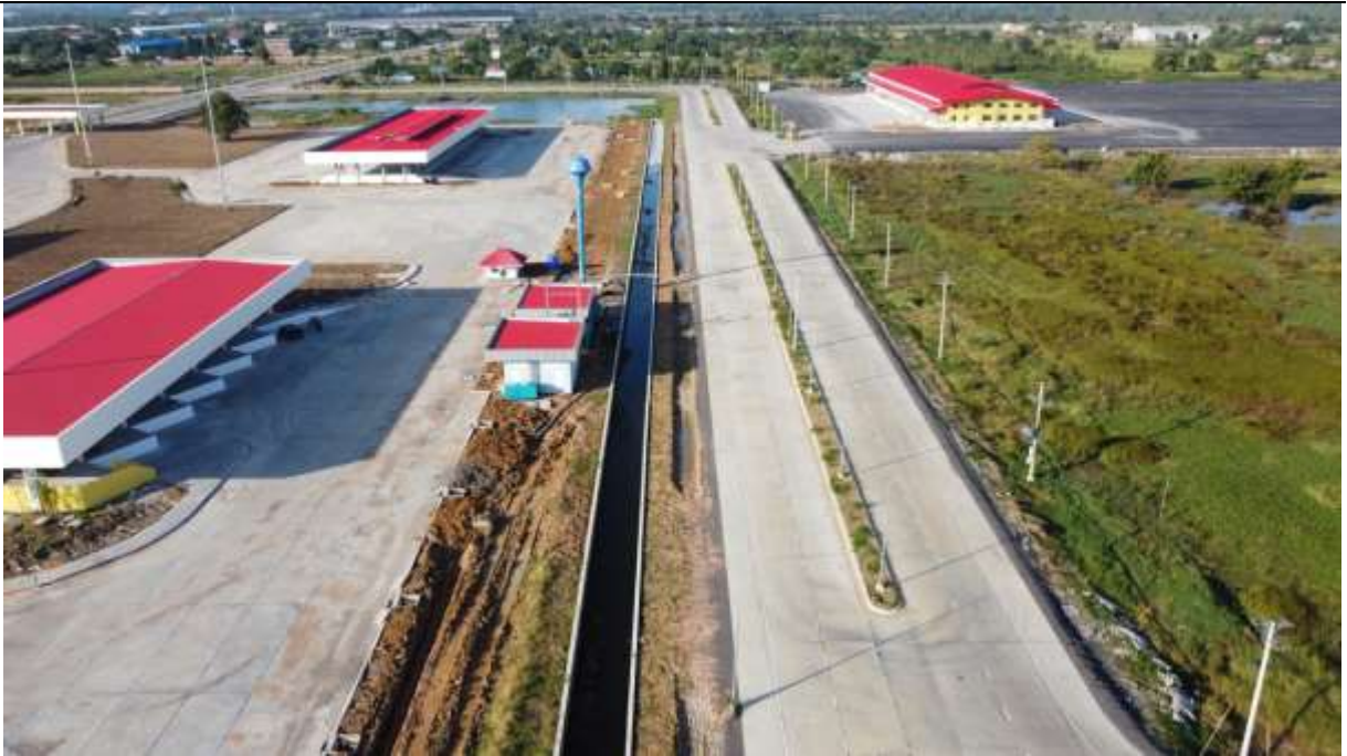
Pump house and power house