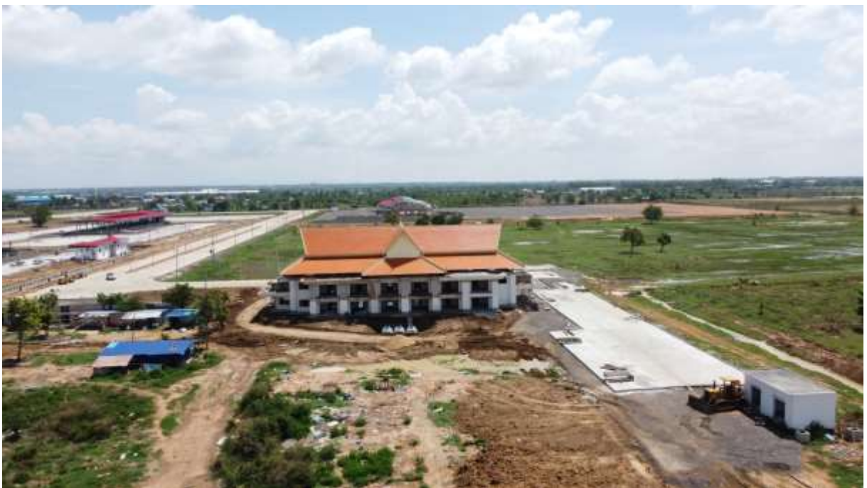
Dormitory and access road